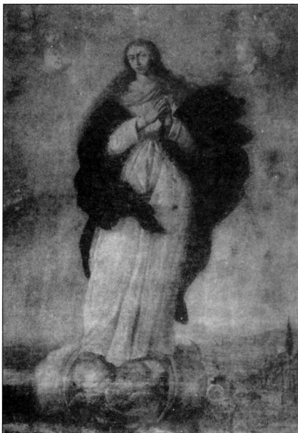
Figura 3. Inmaculada. Museo de Semana Santa de Orihuela. Perteneciente al antiguo Convento de San Gregorio de Orihuela.

con el mismo tema también en Orihuela, en la Colección Salvetti 9 . De todos estos cuadros anteriormente citados, con el que más relación y semejanza tiene es con el existente en el Convento de Capuchinas fechado en 1700. Pero, a diferencia del de Orihuela, el de las Capuchinas es de mayor tamaño, calidad, movimiento y riqueza cromática. En ambos lienzos la Purísima es la figura central, la cual emerge sobre unas nubes superpuestas a nivel de tierra con tres cabezas de querubines y símbolos marianos como la luna. Se aprecia una ligera perspectiva conseguida en los dos cuadros por una línea del horizonte muy baja, pequeños detalles de vegetación a menuda escala como el ciprés, torreones y murallas que aluden a las letanías marianas y son representativas de las alegorías de la Concepción Inmaculada.