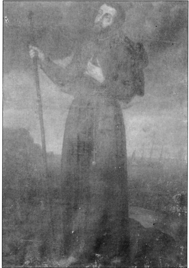
Figura 1. «San Francisco Javier» Convento de San Juan Bautista de Religiosas Clarisas de Orihuela

alcanzar su propósito, lo que le impediría ejercer su oficio en Valencia apremiándole en su salida hacia otras poblaciones con más amplias oportunidades de trabajo y libertad de movimiento. No se conoce la fecha de partida, se conjetura que lo hiciese con Nicolás de Bussy, pero lo que sí se sabe con certeza es que en 1670 estuvo de paso por Onteniente, más tarde en Alicante y posteriormente en Orihuela. 3