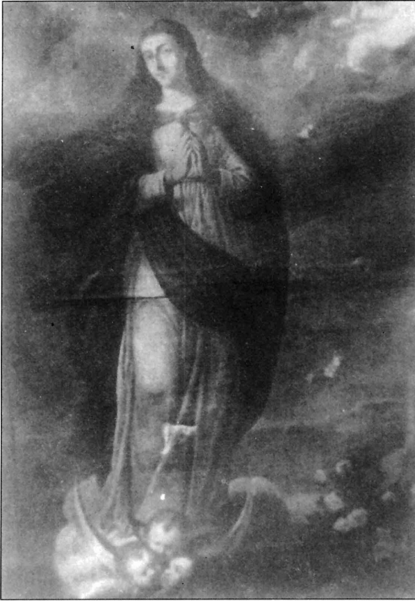
Figura 4. Inmaculada. Convento de Religiosas Capuchinas, Murcia.

Tanto el de Orihuela como el de Murcia son de una gran majestuosidad y perfección de líneas frente al color, influenciado por la escuela pictórica valenciana. Sus rostros son afilados, más trabajados y delicados en el de Murcia y de menos belleza en el de Orihuela. Lo que confiere a ambas imágenes un mayor realce es el estudio del plegamiento y voluminosidad de los paños, que se hinchan dando forma al contorno y movilidad a la figura, junto con los violentos contrastes de luces y colores que son más claros y cálidos en un primer plano y más intensos y oscuros en una alta degradación al fondo. Así ese color blanco y pétreo de la túnica contrasta con el azul intenso del manto y el dorado rompimiento del cielo en el de Orihuela, frente al movimiento y abundante decoración de angelitos que portan sus atributos en el de Murcia.