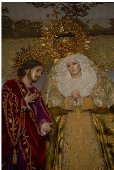
3. Nuestra Señora de la Esperanza y San Juan Evangelista. Vicente Tena. 1901. Osuna.

Juan Evangelista y 20 Ptas. de embalaje”. De junio de 1902 a junio de 1903, se registraron dos pagos, uno de 1500 pesetas por la adquisición de las imágenes y otro de 37 pesetas abonado en concepto de portes. La efigie de la Virgen recibió una nueva advocación, de la Esperanza, rompiendo con el recuerdo de la anterior. (Fig. 3)