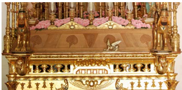
5. Detalle del trono de Nuestra Señora de la Esperanza. Diseño de Vicente Tena. 1903. Osuna.

varios brazos y tulipas de cristal que, antes de mediados de siglo, fueron suprimidos (Fig. 5). Un ejemplo posterior en el empleo del estilo asirio en una cofradía penitencial aparece en Zaragoza, en concreto en el palio del Cristo de la Cama de la procesión del Santo Entierro, proyectado por José Nasarre Larruga y Mariano Oliver Aznar en 1910 15 .