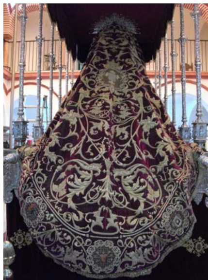
6. Manto de María Santísima del Mayor Dolor. Diseño de Francisco Javier Govantes y ejecución de las monjas clarisas. 1917. Osuna.

Este magnífico manto morado es de estilo neobarroco de ascendencia romántica y fue bordado en hilo de plata dorado y sedas de colores, con una rica iconografía, rasgo que lo singulariza y diferencia del resto de mantos de las dolorosas de Osuna. Representa a cuatro ángeles en las vistas frontales con filacterias en las que se lee: “ attendite et videte / si est dolor / sicut dolor / meus ”, “Mirad si hay dolor como mi dolor”, cita procedente de las Lamentaciones de Jeremías 1.12. Este breve texto no fue aleatorio ya que concuerda con la advocación de la Virgen que, con gran probabilidad, sería propuesta por el propio Arcipreste Govantes. En una gran greca perimetral, se reparten cartelas circulares con los atributos de la Pasión: bolsa con monedas, corona de espinas y clavos, cruz y escaleras, jofaina y jarra, gallo, el paño de la Verónica, martillo y tenazas, columna, dados y túnica. Estos motivos parecen tomados del intradós del retablo del Santísimo Cristo de la Paz. Por último, se reprodujo el escudo de la corporación en el